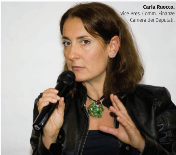
Carla Ruocco. Vice Pres. Comm. Finanze Camera dei Deputati.

L A GIORNATA di lavori, realizzata in collaborazione con Italia Oggi e con l'Ordine dei Dottori Commercialisti e degli Esperti Contabili di Pisa, gode del patrocinio del Senato della Repubblica, della Camera dei Deputati, del Consiglio di Presidenza della Giustizia Tributaria, dei Comuni e delle Province di Pisa e di Livorno, della Regione Toscana, della Conferenza delle Regioni e delle Province Autonome, dell'Anci, dell'Università di Pisa, delle Fondazioni Buozzi e Nenni, del Consiglio Nazionale dei Dottori Commercialisti e degli Esperti Contabili, dell'Ordine dei Dottori Commercialisti e degli Esperti Contabili di Livorno, della Cassa Nazionale Previdenza Ragionieri, dell'Ordine degli Avvocati di Pisa, della Confprofessioni e del Coordinamento Interpro-